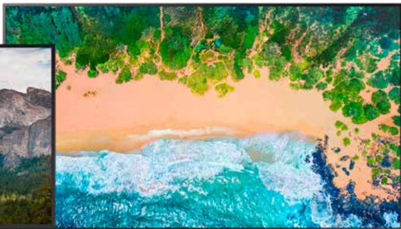
LG, 65-Zoll Smart-TV um nur 849,-€