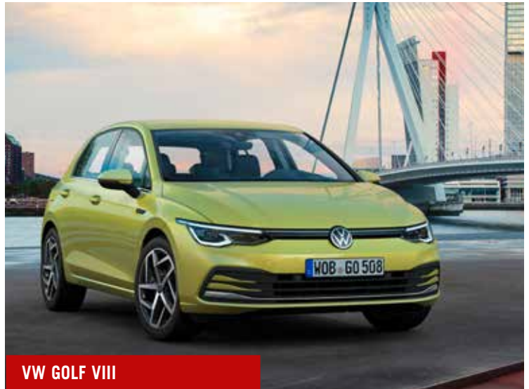
VW GOLF VIII