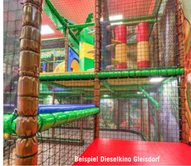
Beispiel Dieselkino Gleisdorf