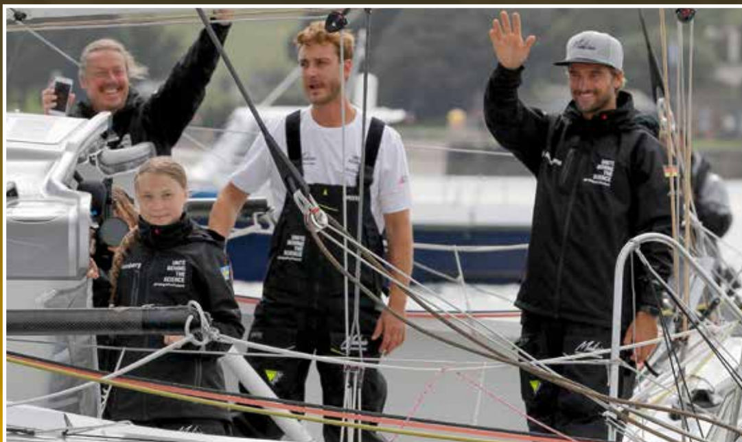
PR-Coup der Extraklasse: Pierre Casiraghi (Mitte) brachte die Thunbergs (links) klimaneutral über den recht stürmischen Atlantik nach New York.

W ürden Nobelpreise nach Bekanntheitsgrad vergeben werden, hätte er wohl Greta Thunberg (16) zugesprochen werden müssen und nicht Abiy Ahmed, dem Präsidenten Äthiopiens. Greta Thunberg ist ein Medienstar in den wohlhabenden Industriestaaten – also überall dort, wo man den Klimawandel für das dringlichste Problem der Gegenwart hält. Der Aufstieg von der unbekannten Schülerin zur Wortführerin der „Fridays for Future“-Bewegung in weniger als einem Jahr ist absolut erstaunlich.