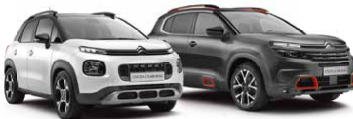
CITROËN C3 AIRCROSS SUV bis zu 520 l Kofferraumvolumen, 85 Farbkombinationen

BIS ZU € 3.000,- SUV-BONUS + GRATIS WINTERKOMPLETTRÄDER*