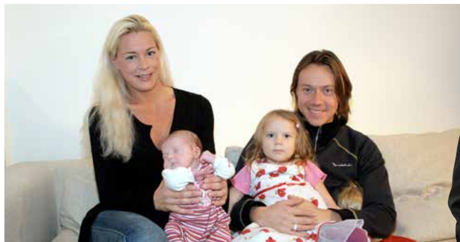
Promifamilie. Die Thunbergs, als die Welt noch in Ordnung war. rechts: Greta, links: Beata.

Schwarz-Weiß. Dass sie die Welt in Schwarz und Weiß einteilt, weiß Thunberg selbst, sie sieht das nicht als Beschränkung, sondern, wie sie es ausdrückt, als „Superpower“. In Gretas Welt brennt der Planet, während böse Konzerne daran verdienen und faule Regierungen nicht auf die Wissenschaft hören. Das britische Blatt The Sun nannte diese Sicht der Dinge einen „einfältigen Quatsch“. Man kann es auch höflicher ausdrücken und als „einseitig“ bezeichnen. ★