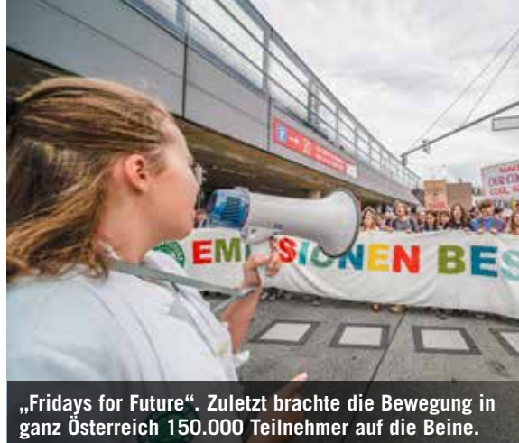
„Fridays for Future“. Zuletzt brachte die Bewegung in ganz Österreich 150.000 Teilnehmer auf die Beine.

ments mit, die Stationen sind Paris, Wien, Amsterdam, Hamburg oder auch Salzburg. Im November 2014 gibt sie in Schweden ihre letzte Opernvorstellung. Ursache des für eine Sopranistin sehr frühen Karriererückzugs ist – Greta. Das Kind ist depressiv und hat eine lebensbedrohliche Essstörung entwickelt. Die Essprobleme bessern sich, aber schließlich diagnostizieren Psychiater bei Greta das „Asperger-Syndrom“ (eine Spielart von