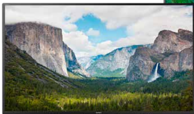
Sony 55-Zoll Smart-TV zum Aktionspreis von 599,-€

Smart-TV um 849,-€. Auch im Bereich Haushaltstechnik gibt es tolle Angebote, wie z.B. eine Gorenje Waschmaschine um 399,-€ statt 579,-€, ein Bosch Wärmepumpentrockner um 633,-€ statt 969,-€ oder ein AEG Herdset um 588,-€ statt 786,-€.