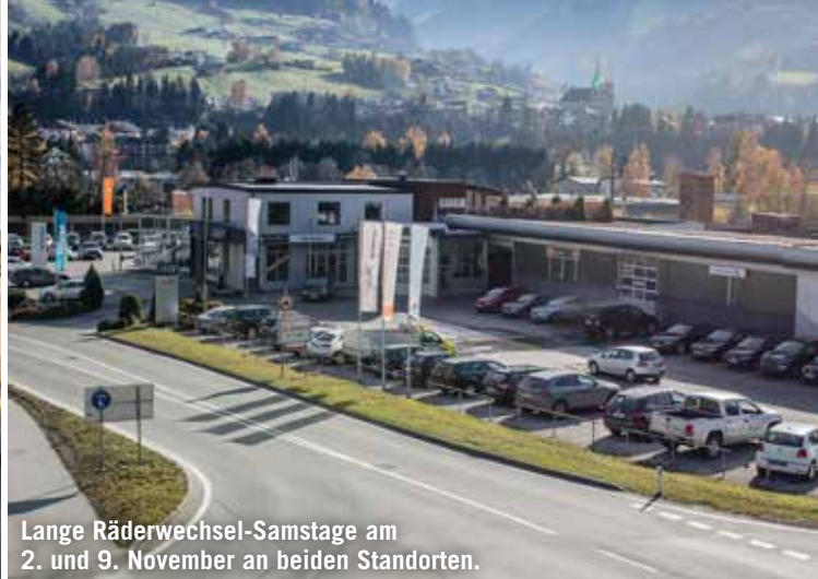
Lange Räderwechsel-Samstage am 2. und 9. November an beiden Standorten.